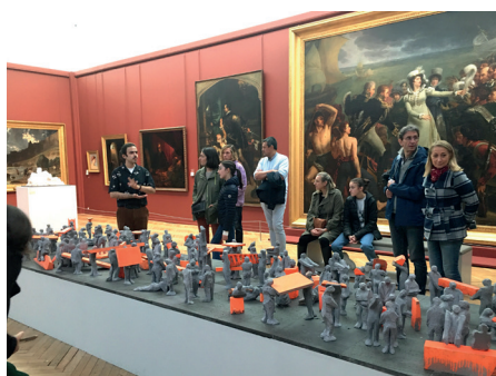
Exposition du sculpteur Denis Monfleur