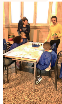
Drôles de masques