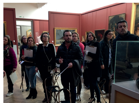
Cours de dessins adultes