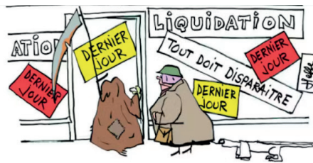
C'est plus fort que moi. Conscience professionnelle.

Créé en 2016 par un professeur de Lettres, l'atelier théâtre du Lycée Odilon Redon est devenu avec le temps un espace de liberté, d'expression et de créativité. En effet, la troupe de lycéens ne reprend pas des œuvres existantes, elle crée ses propres pièces avec l'aide du professeur de Lettres et répète avec un comédien une soirée par semaine pendant 3h30. Chaque année la troupe donne 3 représentation entre mai et juin Par ailleurs, la section théâtre participe tous les ans aux « Didascalies » de Périgueux, festival reconnu dans le milieu enseignant, né du désir de partager, entre lycées, le plaisir et l'expérience du théâtre. Ces rencontres se sont toujours adressées à des lycéens motivés et volontaires, accompagnés dans leurs pratiques par des professeurs formés et impliqués ainsi que par des artistes professionnels désireux d'ouvrir leurs démarches aux jeunes.